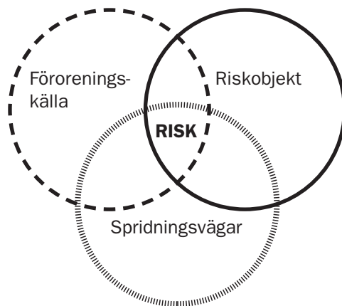
Figur 3. Illustration av miljö/hälsorisken av ett kulfång.

Negativ påverkan av en förorening i mark eller vatten kan enbart ske om föroreningen överstiger en viss halt, det finns ett riskobjekt samt en exponeringsväg mellan föroreningen och riskobjektet. Med andra ord, enbart förekomsten av en förorening innebär inte automatiskt en risk för påverkan. Detta har exemplifierats i Figur 3.