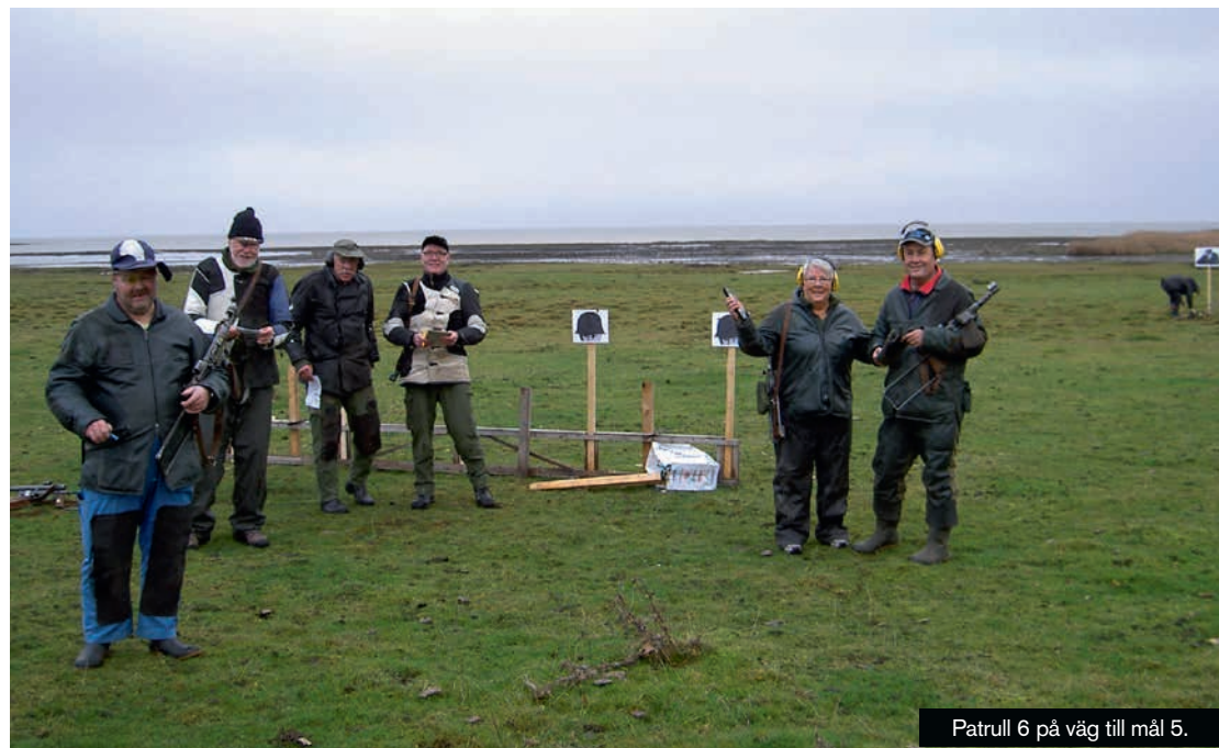
Patrull 6 på väg till mål 5.