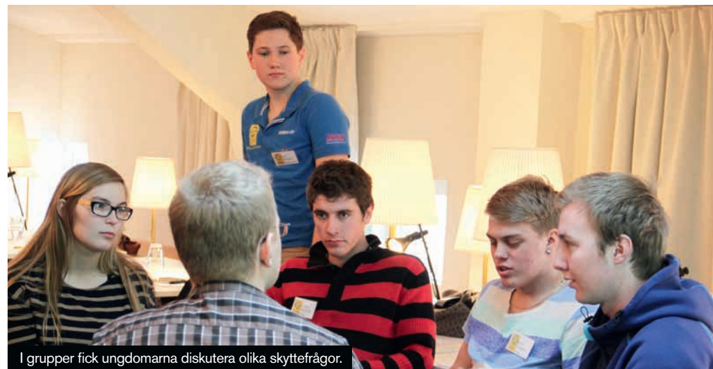
I grupper fick ungdomarna diskutera olika skyttefrågor.

Uppvärmda från lördagen var det dags för mer diskussioner i smågrupper på söndagen. Tiden var begränsad och vi fick tyvärr bryta mitt i. De frågor som togs upp vid detta pass var hur gruppens intresse att engagera sig var, om det är mest intressant att sitta i en styrelse eller är det mer attraktivt att vara med i kortare projekt och i så fall vilken typ av projekt. Alla smågrupper sa att de inte var intresserade av att ta en post i ungdomsrådet. Det kändes som ett hårt slag i magen men sedan kröp det fram, från alla grupper, att det ville veta lite mer – hur mycket tid innebär det, vad förväntas och hur funkade det praktisk. Jo, då blev det lite mer intressant. För de flesta var det ändå mest intressant att framöver vara med på kortare tidsbegränsade projekt. Lämpliga projekt var framför allt breddläger men också annat, som kringaktiviteter på tävlingar.