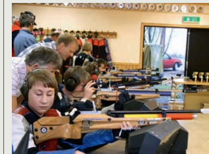
Finalfältet L13-15 förbereder sig.