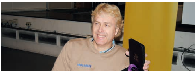
Jonas Jacobsson fanns på plats med sin Paralympicsmedalj.