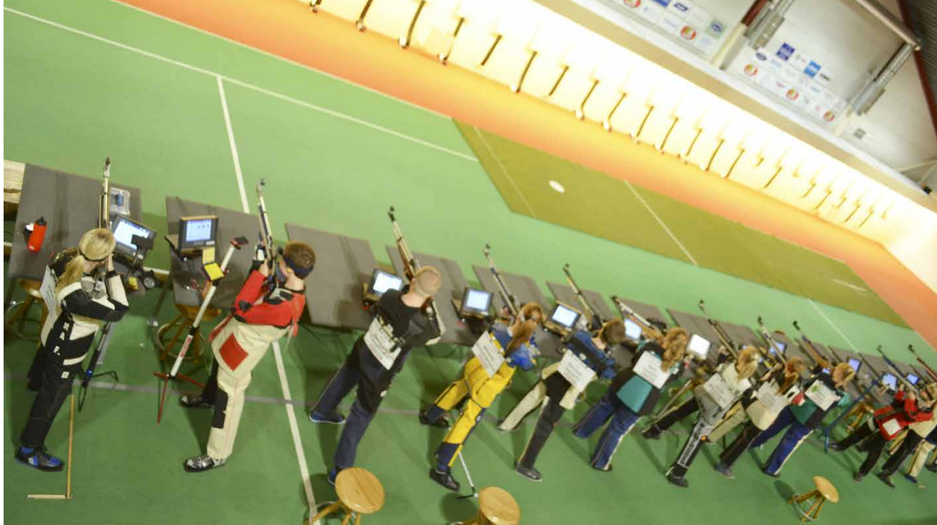
Skyttarna lite från ovan.