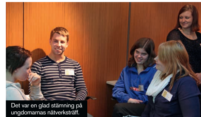
Det var en glad stämning på ungdomarnas nätverksträff.