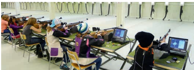
Skyttehallen i Vindeln.