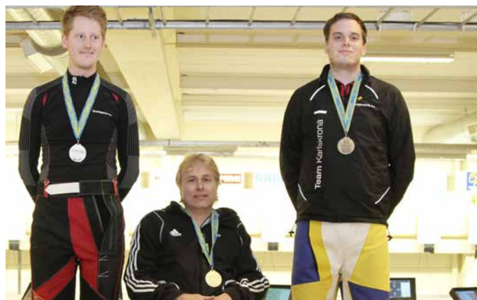
Karl-Johan Jönsson, Jonas Jacobsson och Mikael Svensson.