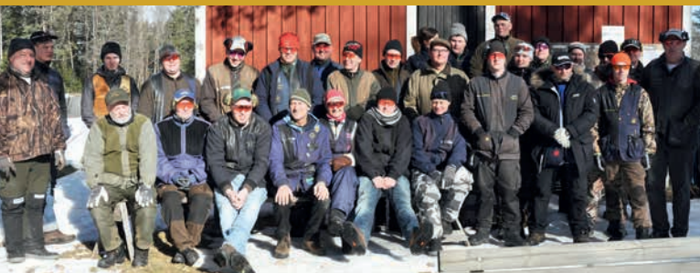
Ett stort antal sportingskyttar samlade för läger på Vikbolandet.

Söndagen den 10 mars hölls ett gemensamt träningsläger för FITASC- och engelsk sporting-skyttar. Detta var på Vikbolandet där banan från en Mälarcuptävling på lördagen fick stå kvar till på söndagen för att utnyttjas för lägret.