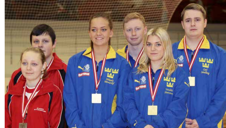
Pistoljuniorerna med sina guldmedaljer.