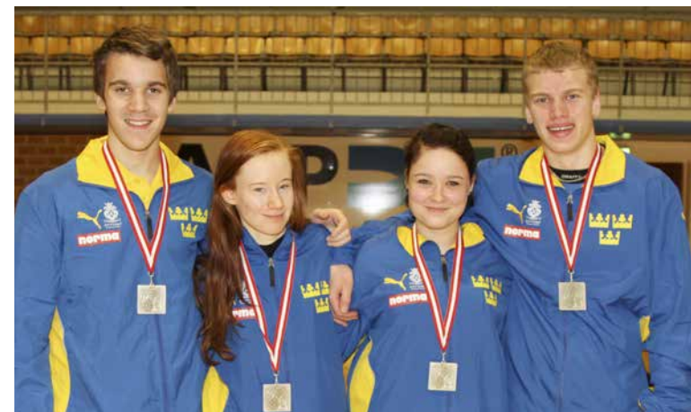
Gevärsjuniorerna med silver.