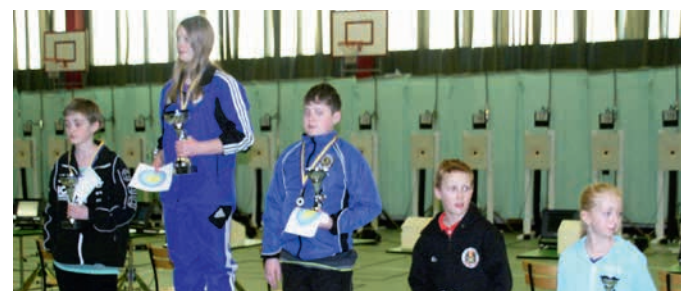
Svenska Ungdomscupen i Töreboda.