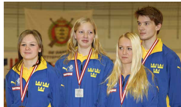
Gevärs seniorerna med sina silver.