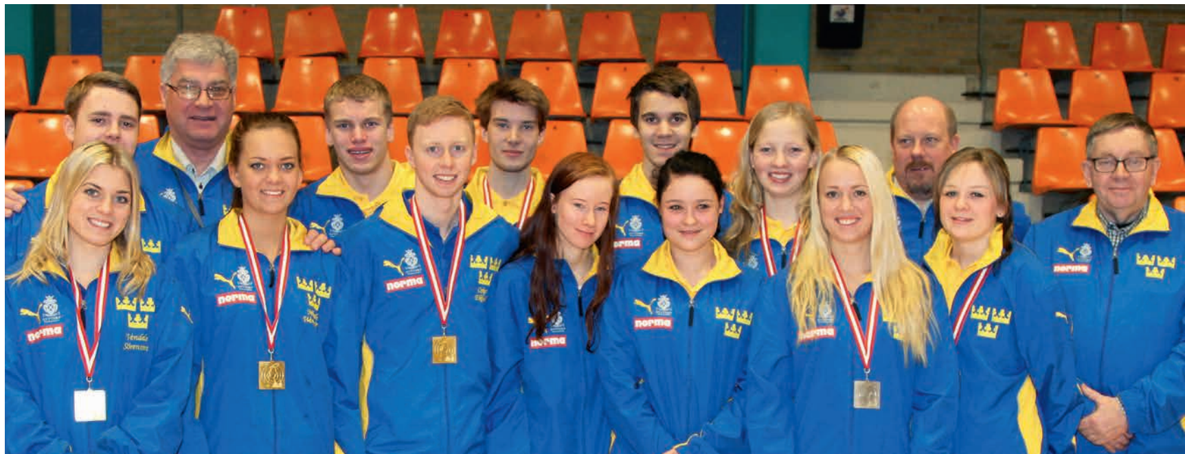
Svenska truppen på landskampen.

Helgen 25-27 januari var det dags för den årligt återkommande landskampen i Faling Target. Som värd för 2013 års evenemang stod Danmark och den jylländska staden Fredericia. Tävlingsarna innehöll både individuella och lagmässiga moment där skyttar från Sverige, Danmark och Finland gjorde upp om titeln nordiska mästare.